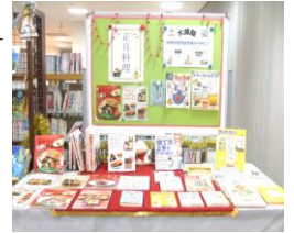
大掃除・正月料理