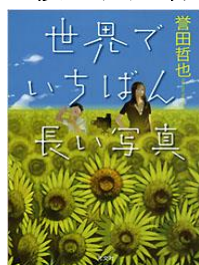
「世界でいちばん長い写真」 菅田哲也著