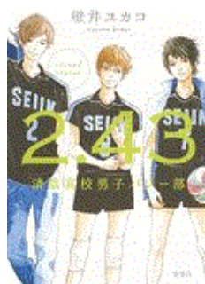
「2.43 清陰高校男子バレー部」 壁井ユカコ著