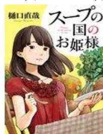
「スープの国のお姫様」 樋口直哉著